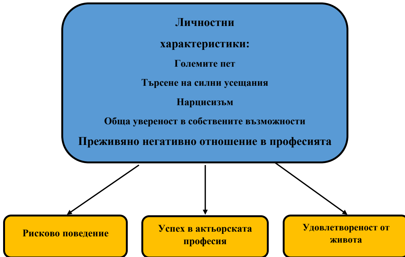
Фигура №1 Теоретичен модел на изследването

Въз основа на направения анализ може да се очертае следният теоретичен модел (Фигура №1).