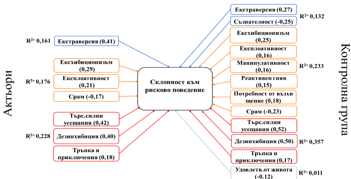
Фигура №2 Предиктори на рисковото поведение със статистическа значимост в групата на актьорите (ляво) и в контролната група (дясно). За всеки от предикторите в скоби е посочен коефициент на регресия (β), посочен е и коригираният коефициент на детерминация ( R^2 ) за всяка група променливи. „Търс. силни усещания“ = „Търсене на силни усещания“; „Удовлетв.от живота“ = „Удовлетвореност от живота“; „Тръпка и приключения“ = „Търсене на тръпка и приключения“.

Статистически значимите предиктори на склонността към рисковото поведение са представени графично във Фигура №2.