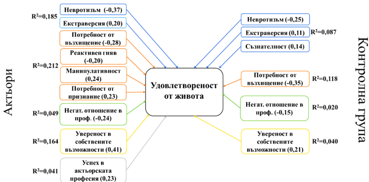
Фигура №3 Предиктори на удовлетвореността от живота със статистическа значимост в групата на актьорите (ляво) и в контролната група (дясно). За всеки от предикторите в скоби е посочен коефициент на регресия ( \beta ), посочен е и коригираният коефициент на детерминация ( R^2 ) за всяка група променливи. „Негат. отношение в професията“ = „Преживяно негативно отношение в професията“; „Увереност в собствените възможности“ = „Обща увереност в собствените възможности“.