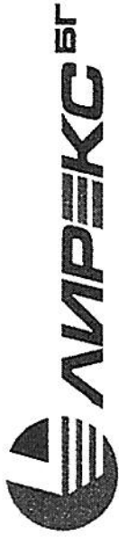
Таблица № 8А към Образец № 8

БИК: 121057952 Банка: Алианс Банк България АД IBAN: BG4880195611010007719