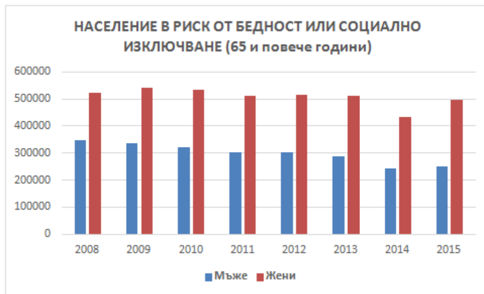
Фиг. 3. НСИ, Население в риск от бедност или социално изключване на 65 и повече години (2008-2015 г.)