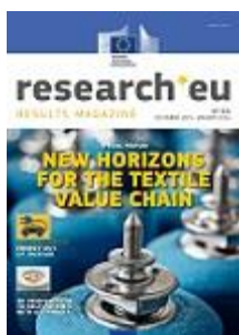
Issue 48 - December 2015/January 2016