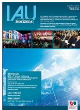
IAU Horizons - [Vol. 18, no.3 & Vol.19, no.1]

IAU Horizons, the Association's news and information magazine is addressed primarily to IAU Member Institutions and Organizations, but is also sent to a selected audience beyond the IAU Membership such as Ministries of Higher Education, international organizations, national and regional associations of universities and others.