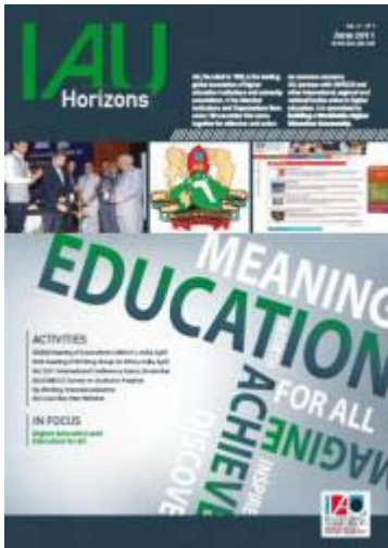
Volume 17, no.1, June 2011