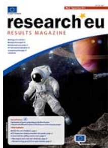
Issue 5 - September 2011, Languages: en (4,9 MB)