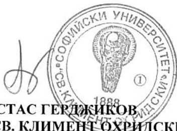
ПРОФ. Д-Р АНАСТАС ГЕРДЖИКОВ РЕКТОР НА СУ „СВ. КЛИМЕНТ ОХРИДСКИ“