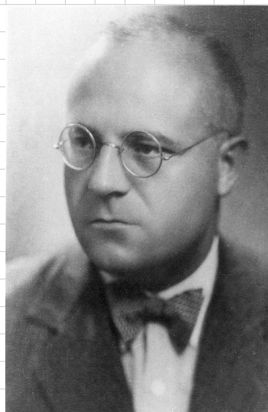
проф. Иван Странски