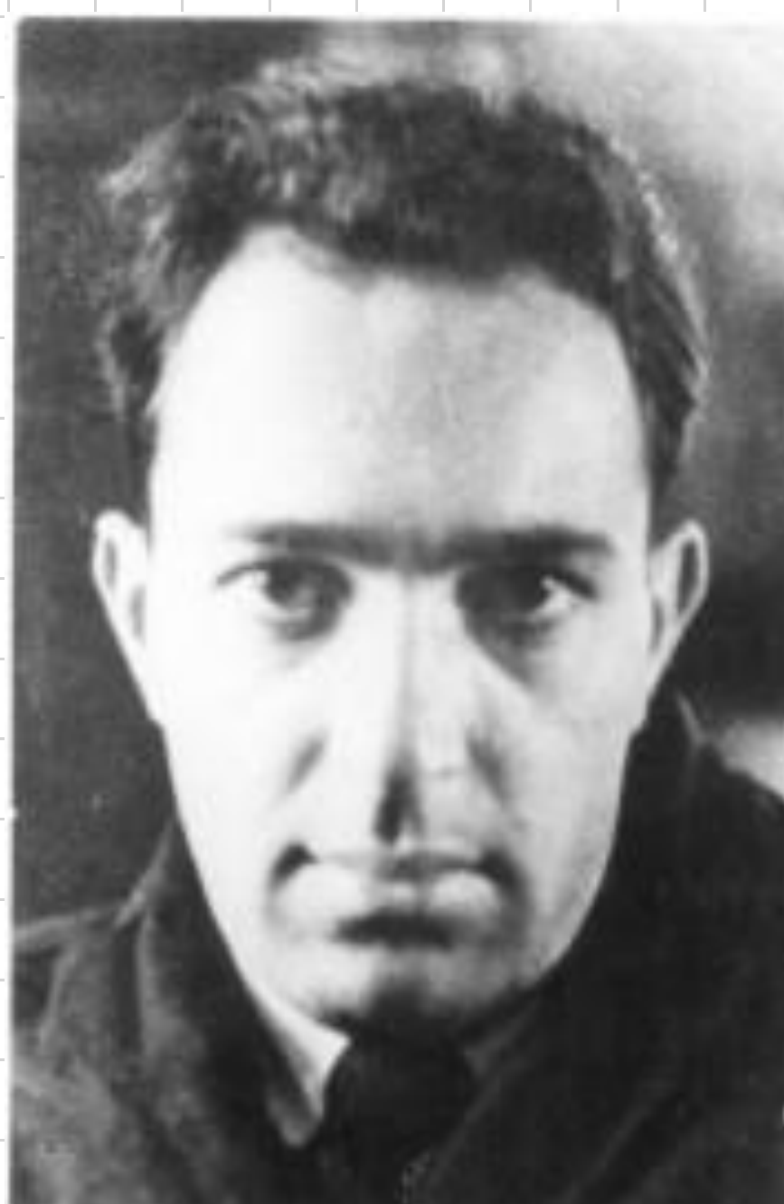
акад. Ростислав Каишев