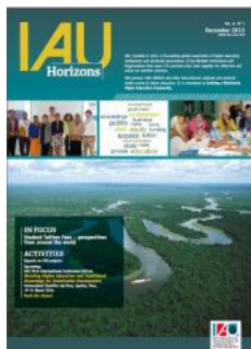
IAU Horizons Vol.19 No.3