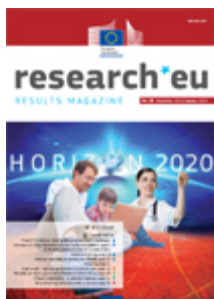
Issue 18 - December 2012/January 2013