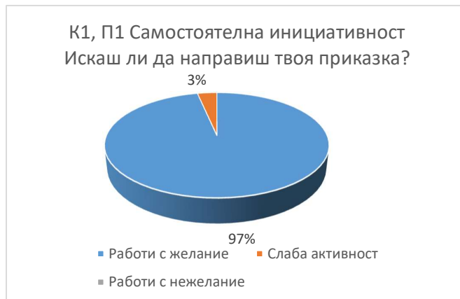
Фиг. 3-2. Резултати по К1,П2 за 3-та група

От кръговата диаграма е видно че само 3% от децата са проявили слаба активност, а при останалите 97% от децата готовността и желанието за работа са големи.