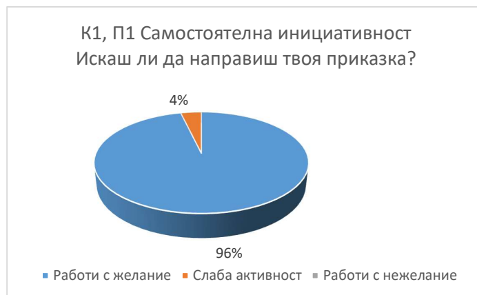
фиг. 3-4. Резултати по К1,П2 за 4-та група

Резултатите от кръговата диаграма отчитат висок процент на децата, които с желание са готови да изпълнят поставената им изобразителна задача. Само 4% от тях изпитват колебание и проявяват слаба активност.