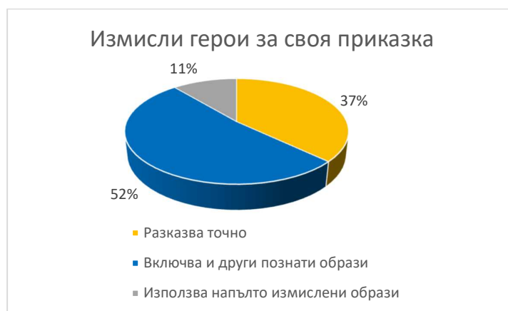
Фиг. 3-5. Резултати за 4-та група

Резултатите от кръговата диаграма отчитат висок процент на децата, които с желание са готови да изпълнят поставената им изобразителна задача. Само 4% от тях изпитват колебание и проявяват слаба активност.