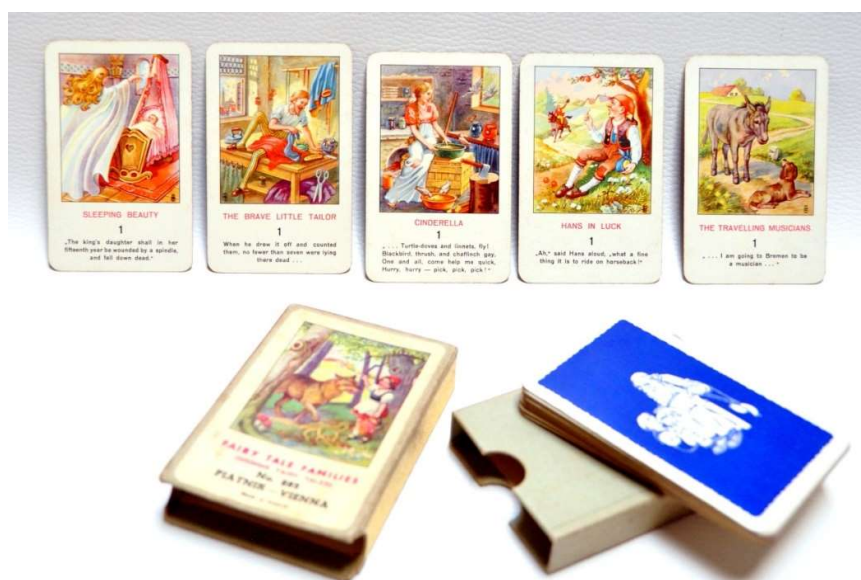
Фиг. 0-1 Игра с карти “Fairy Tale Families”

Развитието на Игри с карти по сюжети от класически и народни приказки за възрастни и деца започва през 50-те години на ХХ век и продължава до наши дни. В следващото изложение е направен преглед на тази форма на игрово представяне на сюжетите от приказките, имаща значение за стимулиране и развитие на интереса на децата към илюстрирания художествен текст.