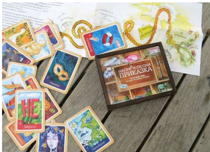
Фиг. 0-2 Игра с карти “Направи си сам приказка”