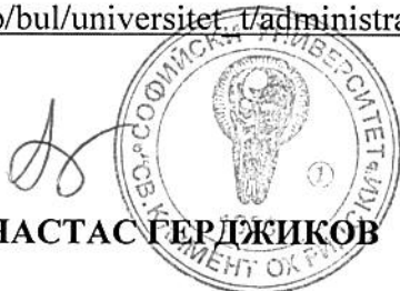
ПРОФ. ДФН АНАСТАС ГЕРДЖИКОВ РЕКТОР

https://www.uni-sofia.bg/index.php/bul/universitet/administraciya/otdel_obschestveni_por_chki/profil_na_kupuvacha