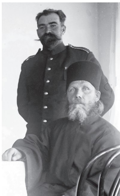
Фиг. 5. Фрагмент от снимка 03–7 от „Архива „Гипсър““, направена на 1 февруари 1913 г. Правият, с военна униформа е проф. Анастас Иширков Fig. 5. Fragment of photo 03-7 from the Gipsion Archive, taken on February 1, 1913. The standing man with military uniform is prof. Anastas Ishirkov

Най-близко разположеният във времето и точно датиран портрет на проф. Анастас Иширков е снимка 03–7 от „Архива „Гипсър““ (фиг. 5), направена на 1 февруари 1913 г., т.е. по-малко от три години преди професорът да отиде в студиото на Димитър Карастоянов. Тя е от пътуването на Богдан Филов и Анастас Иширков из Беломорието и Източна Тракия и е заснета от Филов в манастира „Св. Андрей Първозвани“ край с. Правища, недалеч от Кавала. Сравняването на двете фотографии не показва големи промени в образа на Анастас Иширков за тези три години.