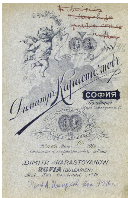
Фиг. 4. Фотографията на Анастас Иширков – гръб

Fig. 3. Photo of Anastas Ishirkov