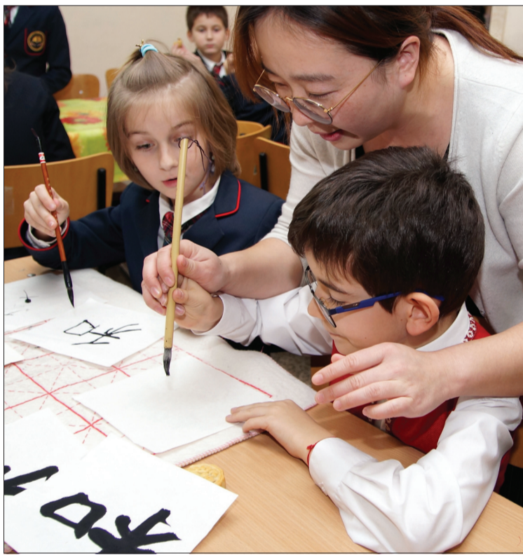
Учители от института „Конфуций“ показват на децата как се изписват йероглифи.