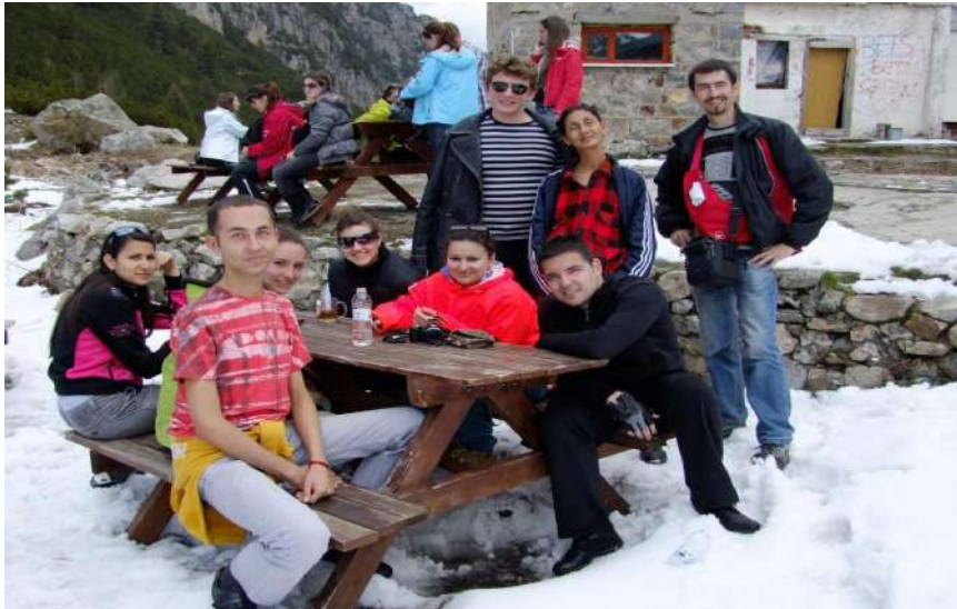
Фотография 34. На хижа „Мальовица“, 10 години по-късно (11 май 2019 г.)