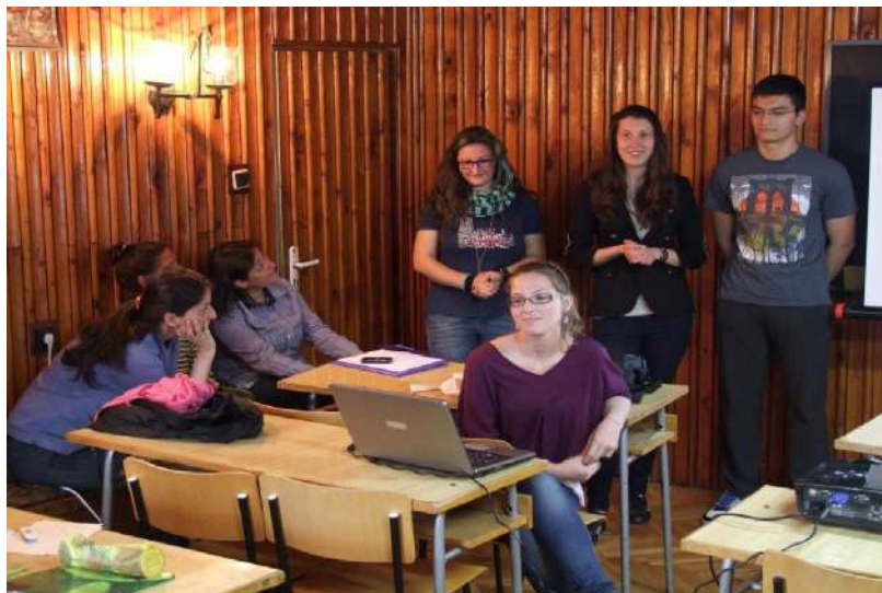
Фотография 20. Оживено обсъждане на студенти от специалност Неформално образование (14 май 2011 г.)