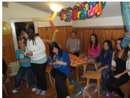
Фотографии 42а и 42б Игра на маса (2015) и на дансинг в столовата на базата (2016)