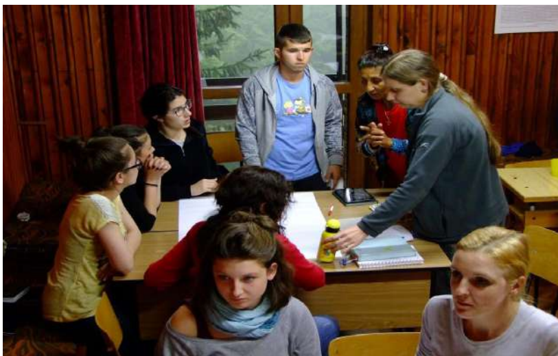
Фотография 18. Студенти от специалност Педагогика представят работата си (22 май 2016 г.)