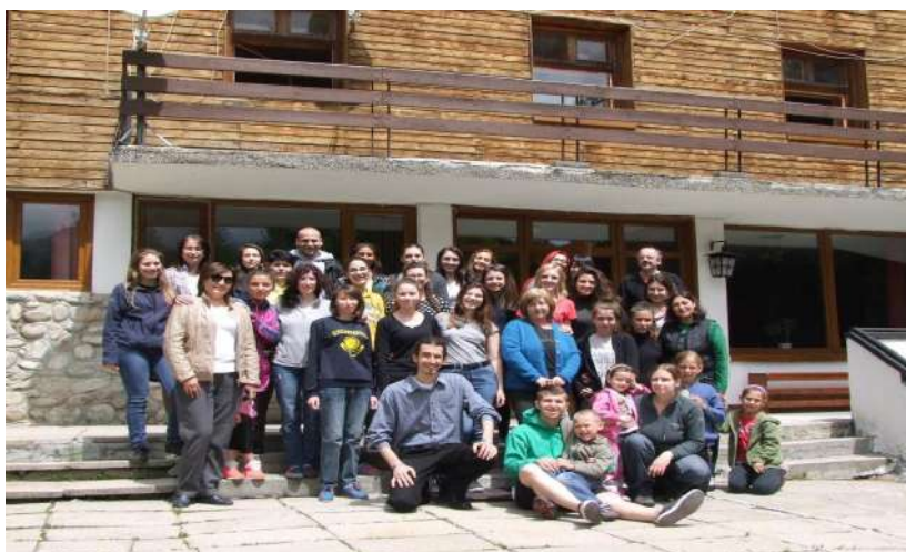
Фотография 11. Участниците в осмия образователно-консултативен семинар „Академични хоризонти“ (14 май, неделя 2017 г.)