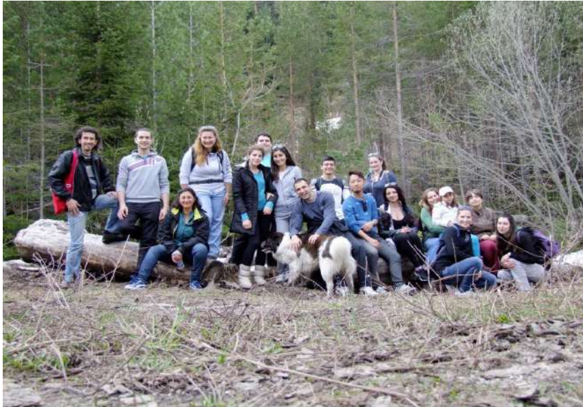
Фотография 30. Физически упражнения на т.нар. сечище (осми семинар, 12 май 2017 г.)