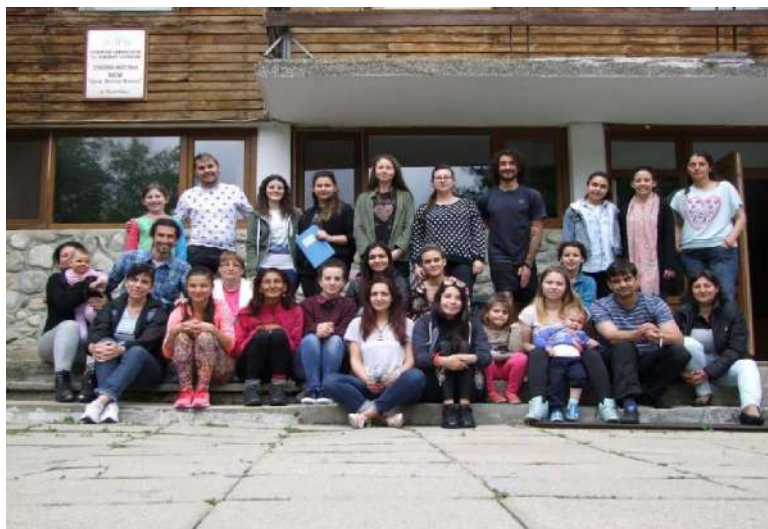
Фотография 13. Участниците в десетия (юбилеен и международен) образователно-консултативен семинар „Академични хоризонти“ (12 май, неделя 2019 г.)