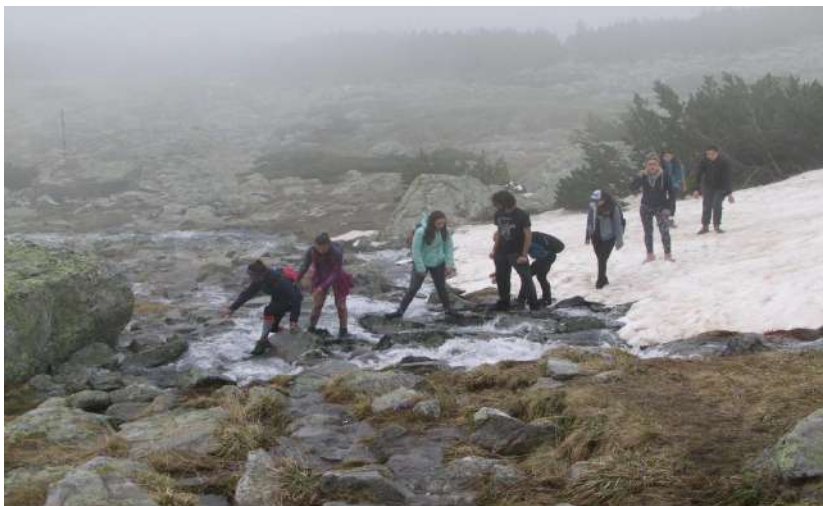
Фотография 38. Близо до Еленин връх (2654 м.н.в.), 20 май 2012 г.

... и продължаваме нагоре през препятствията (и двете фотографии, свързани с този текст, са от 19 май 2018 г., девети семинар)