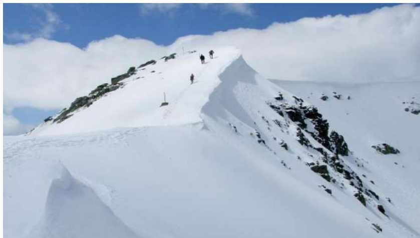
Фотография 40. Първо достигане на връх Мальовица (2729 м.н.в.) със студенти – по време на десетия семинар и в Деня на празника на Факултета по педагогика, Св. Св. Кирил и Методий (11 май 2019 г.)