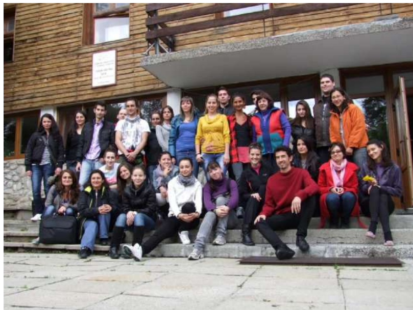
Фотография 7. Участниците в четвъртия семинар (19 май, неделя 2013 г.)