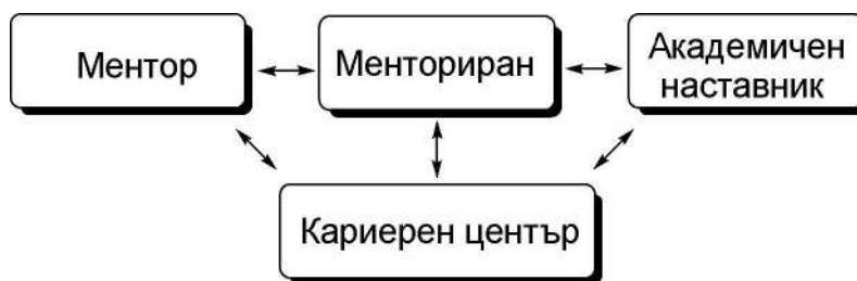
Модел на менторство във ФП

Една от основните дейности на Кариерния център е развитие идеята за менторство във ФП , чиято необходимост и значимост беше защитена на ФС и подкрепена чрез гласуване и реализирана за първи път в СУ „Св. Климент Охридски“. Бяха систематизирани проучвания, показващи, че студенти, които са имали менторски взаимоотношения, имат по-висока продуктивност и мотивация и отлична удовлетвореност от техните обучителни програми. От друга страна, за университетските преподаватели менторството води до получаване на награди, на нови знания, развитие на преподавателски методи и техники, сътрудничество в бъдещи проекти, осъществяване на проучвания и т.н. Концепцията бе създадена след апробиране през 2012 г. чрез проект „Модел на менторство във висшето образование – структуриране и апробация“ , НИС, и след анализ (над 40 източника) и разработване на научни статии (вж. повече: Борисова, М., М. Богданов, 2007; Богданова, М., 2010, 2011), като би могла да бъде представена в схемата по-долу: