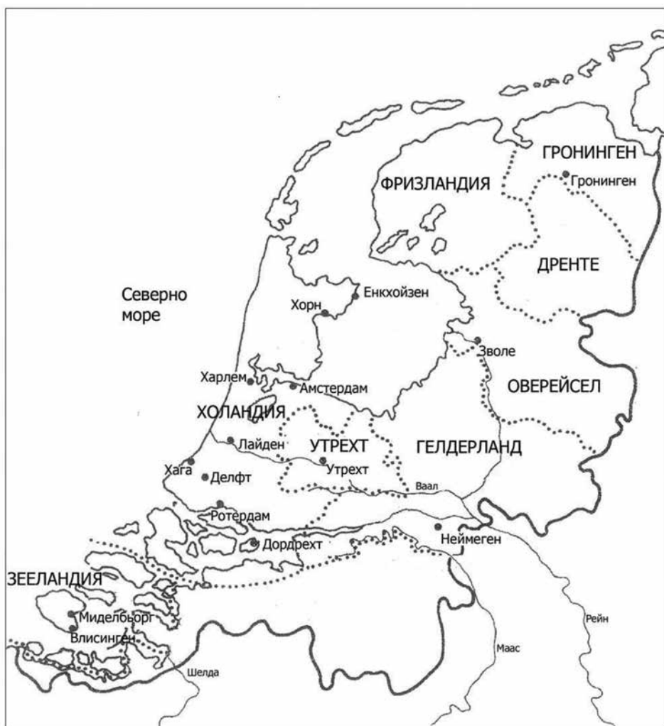
Фиг. 1. Република на Седемте съединени Нидерландии Fig. 1. Dutch republic