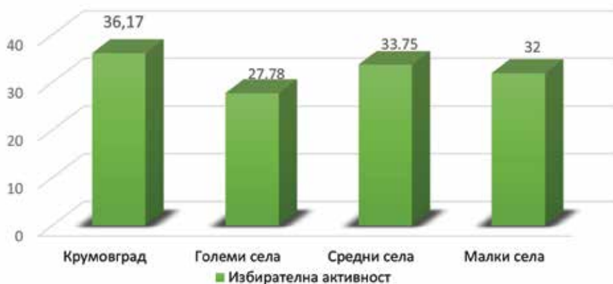
Фиг. 2. Избирателна активност в община Крумовград Fig. 2. Electoral activity in Krumovgrad municipality

В средно големите села с избиратели над 300 души отново ДПС е на първо място с 58,77%, на второ място е партия ДОСТ с 21% подкрепа от гласувалите. Трета политическа сила е ГЕРБ с 7,78% доверие, на четвърто място е БСП с 5,7% от гласовете на електората и на пето място е политическата идея, наречена ВОЛЯ, с едва 0,60% от избирателите.