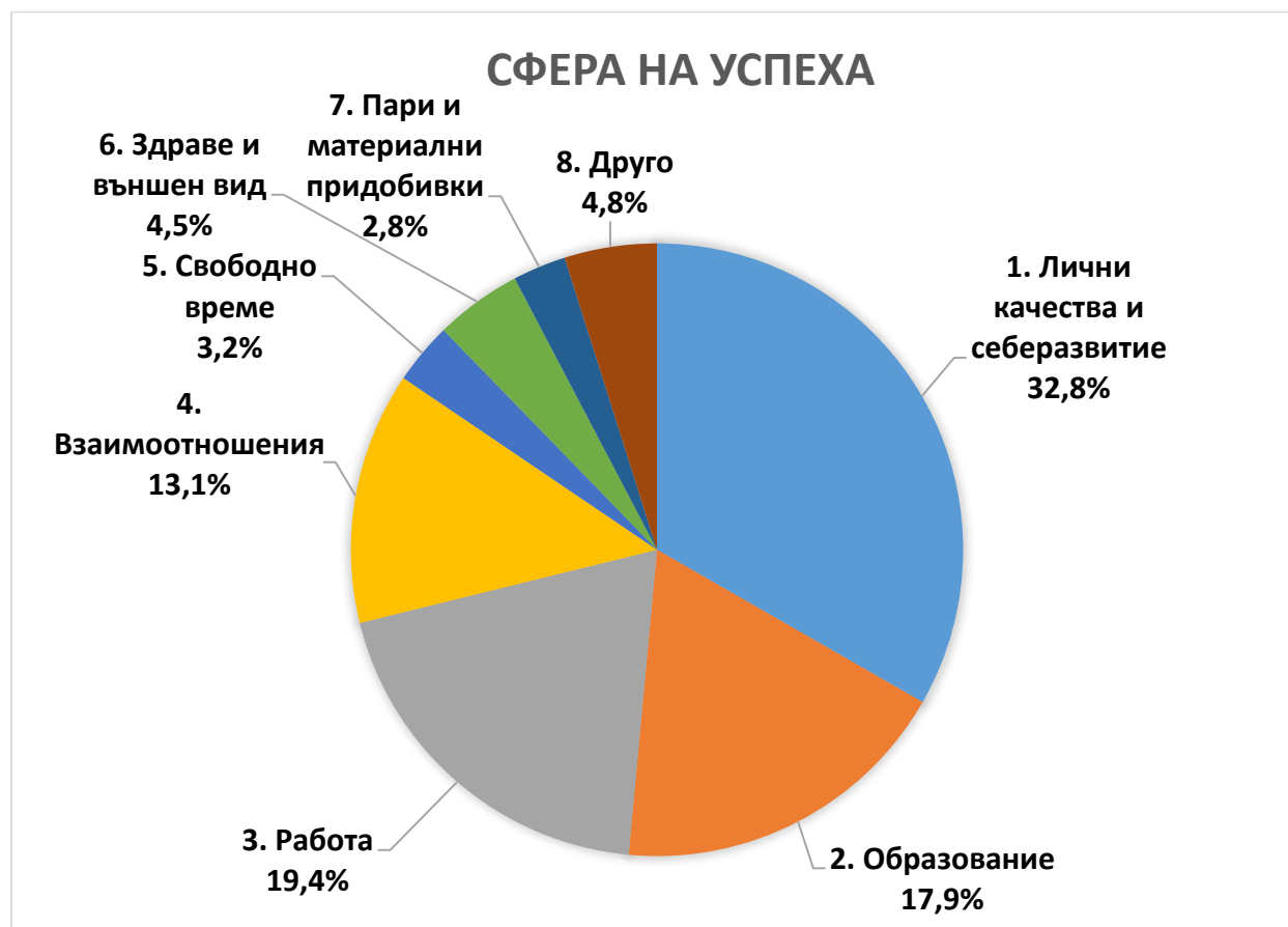
Фиг. 4: Процентно разпределение на категориите на споделян успех

Както е видно от фиг. 4, относително голямо разнообразие от категории на конкретния успех бяха докладвани от участниците.