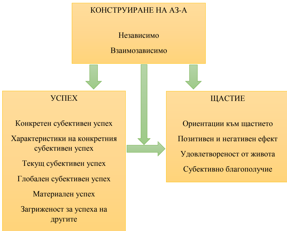
Фигура 1. Теоретичен модел на емпиричното изследване

Всяка една от тези взаимовръзки е била изследвана преди, но при използвани различни променливи. Никое изследване от разгледаните в теоретичния обзор не включва толкова широко разнообразие от променливи, свързани с успеха, и никое не изследва едновременно постигането на целите при конкретен успех и субективния успех на индивида като цяло.