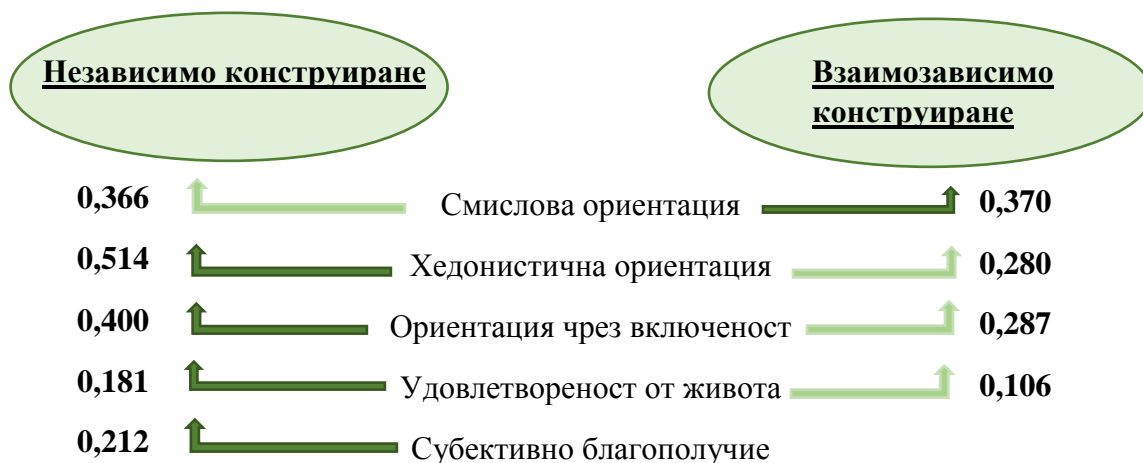
Фиг. 2: Значими корелации между щастието и двата типа конструиране на аз-а