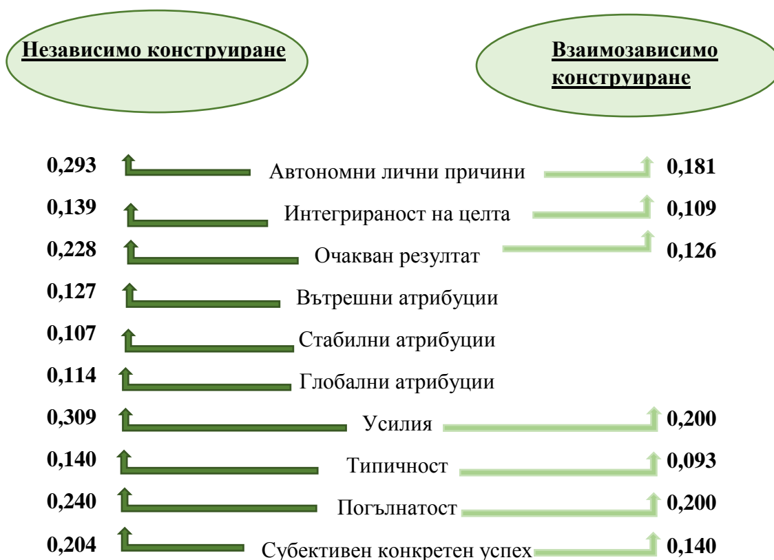
Фиг. 5: Характеристики на конкретния скоросен успех, които корелират по-силно и значимо с независимото конструиране на аз-а

Множество характеристики на успешно постигнатата цел допринасят за позитивния афект както по време на процеса на преследване на целта, така и след нейното успешно постигане. Има и значими различия при предикторите в групата на хората с доминиращо независимо конструиране на аз-а и групата на тези с доминиращо взаимозависимо конструиране. Различия съществуват и между предикторите по време на преследването на целта и след нейното успешно постигане.