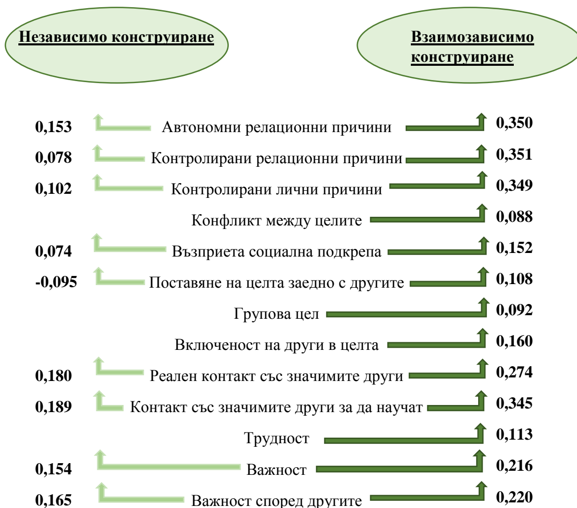
Фиг. 6: Характеристики на конкретния скорошен успех, които корелират по-силно и значимо с взаимозависимото конструиране на аз-а

липсват взаимовръзки между атрибуциите и взаимозависимото конструиране. Поради това, не бихме могли да заключим, че хората с високо взаимозависимо конструиране на аз-а имат по-скромни атрибуции. Вместо това, взаимозависимото конструиране на аз-а изглежда не определя атрибуциите при успеха, докато независимото ги определя, но в много малка степен.