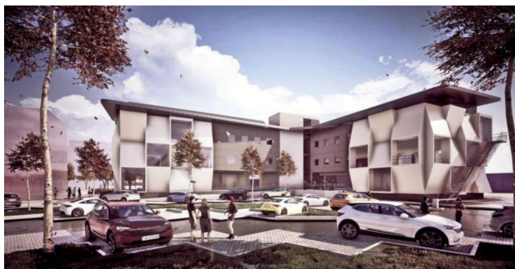
Сграда на ЦВП УНИТЕ

Снимки за новоизграждащата се инфраструктура на СУ с проектиране на специализирани дейности по чисти и дигитални технологии с хоризонт 2023 година. Новостроящите се сгради са финансирани от оперативна програма „Наука и образование за интелигентен растеж“ по проекти: BG05M2OP001-1.001-0004, BG05M2OP001-1.003-0002, BG05M2OP001-1.002-0019