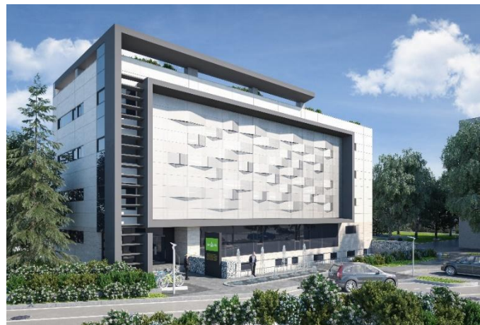
Сграда на ЦК „Чисти технологии и кръгова икономика за устойчива околна среда“