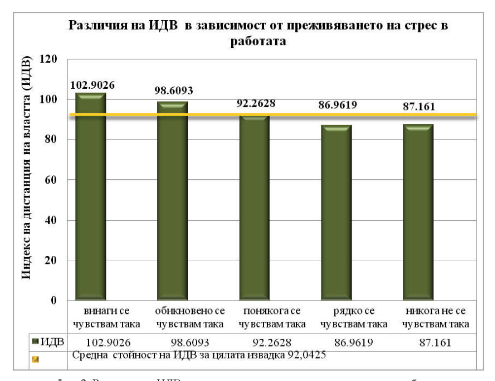
Фиг. 2. Различия на ИДВ в зависимост от преживяването на стрес в работата Fig. 2. PDI differences relative to employees' stress

вяват много силен стрес, силен стрес и умерен стрес) получените резултати са по-високи и нарастват с нарастване на равнището на стрес. Установената диференциация на ИДВ в зависимост от равнището на преживяване на СС, показва, че служителите, които преживяват силен стрес, демонстрират значително по-високо равнище на ИДВ, в сравнение със служителите, които преживяват слаб стрес.