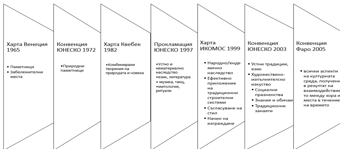
Фиг. №2 Модел на разширяването на обхвата на културното наследство в съдържателен аспект.

Тази промяна може да се проследи в различните видове културно наследство, които се добавят през годините. В тях прозира оценяването и стремежа за извличане на знания и умения от миналото, които да са полезни в настоящето или имат някаква функция (Фиг. №2).