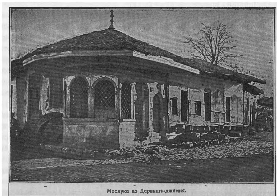
Мослука до Дервишъ-дзямия.

Мослука.