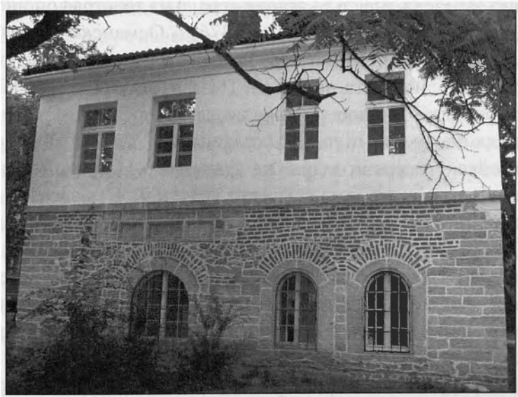
Снимка на турската поща