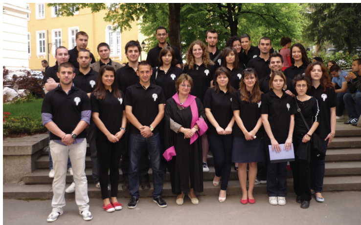
Студентски съвет - мангам 2009/2011