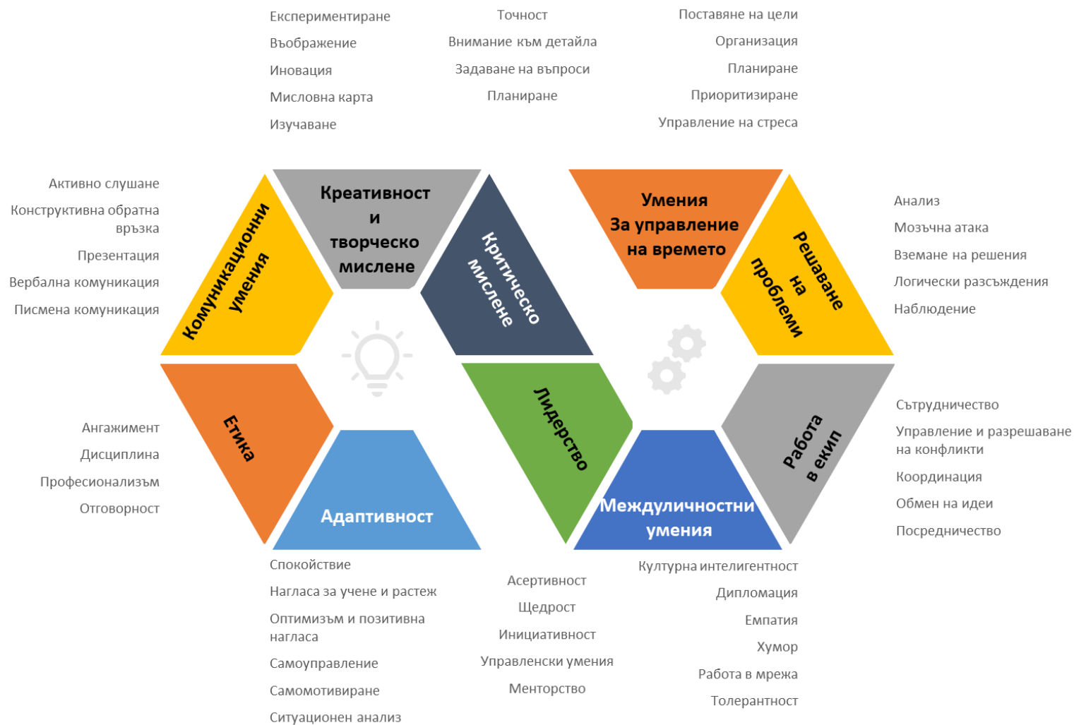
Фигура 4. Схематично представяне на изследваните меки умения (Автор: Г. Сакарски)

Проведеното изследване се базира на подобрите и класифицирани в 10 основни групи умения, които се оценяват по 5 степенна Ликертова скала (1 = най-ниско ниво до 5 = най-високо ниво).