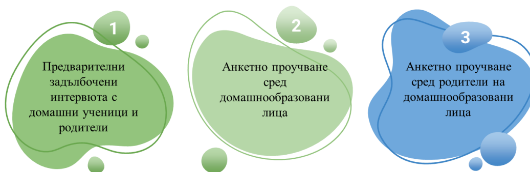
Фигура 3. Инструментарии, използван за целите на изследването (Автор: Г. Сакарски)

Емпиричното изследване, представено в този дисертационен труд, се провежда в няколко етапа на базата на изготвен за целите на проучването инструментариум, който е илюстриран в следната фигура.