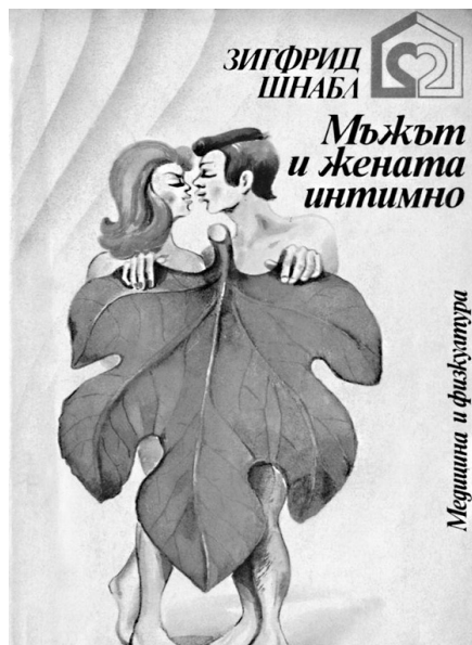
Мъжът и жената интимно – книгата–Библия на социализма

Как се разпознава сексуалността при детето, какви са последиците от нейното анулиране и как се развива тяло-без-удоволствие? Възможно ли е да се отелеси тяло-в-идеология? И какви анализи би направила сега новата дисциплина „социология на тялото“ за политическото влияние върху определени културни полярности чрез институциите на секса (възпроизводството), семейството и патриархата?