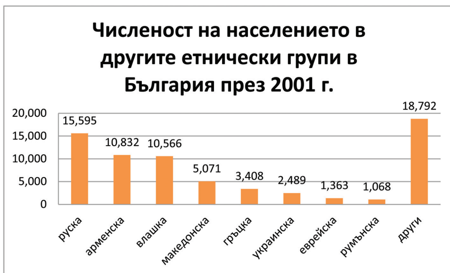
Фиг. 2. Относителен дял на трите основни етнически групи в България, 2011 г.