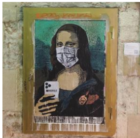
Изображение на известната Мона Лиза с маска срещу коронавируса в Барселона, Испания - https://www.tes.com/lessons/ID9mwr8CT6NmW/tvboy (15.08.2020)