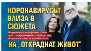
Lupa.bg 04.05.2020 г.