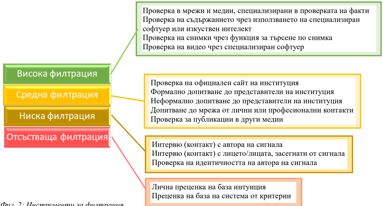
Фиг. 2: Инструменти за филтрация

В този дисертационен труд се прави опит да бъдат подредени различните степени на обработка като различни степени на филтрация, както следва: